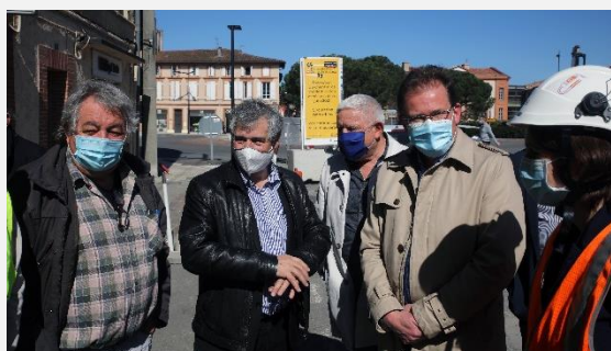
Effacement des réseaux aériens de l'avenue des Pyrénées à Muret.