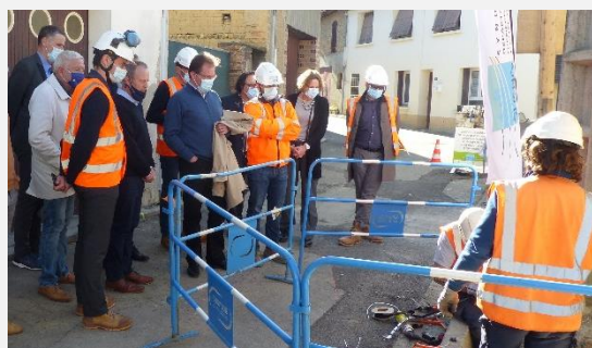
Effacement des réseaux aériens au cœur de Noé.